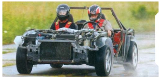
KTU Transporto inžinerijos katedros studentų ir jaunuųjų mokslininkų sukurtas eksperimentinis hibridinis automobilis.

Studijuodami gilinsitės į kelių ir geležinkelio transporto priemonių teoriją, konstrukcijas, gamybą ir techninį modernizavimą, riedmenų diagnostiką, eksploataciją ir remontą, transporto organizavimą; mokysitės, kaip organizuoti transporto priemonių priežiūros ir remonto procesus ir spręsti transporto sistemos darniosios plėtros, energijos sąnaudų ir ekologines problemas; taikysite transporto sistemų ir jų elementų diagnostikos ir projektavimo metodikas.