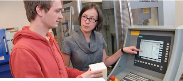
Studentai atlieka laboratorinius darbus programinių staklių laboratorijoje.

Studijuodami gilinsitės į klasikinę ir moderniąją mechaniką, biomechanikos inžineriją, gamybos technologijas, mechaninių sistemų projektavimą ir modeliavimą, medžiagų inžineriją, mokysitės formuluoti, analizuoti ir spręsti techninius mechanikos inžinerijos uždavinius, projektuoti mechaninius ir mechatroninius įrenginius ir jų gamybos įrangą, atlikdami laboratorinius tyrimus, parinkdami, projektuodami ir eksploatuodami technologinius įrenginius.