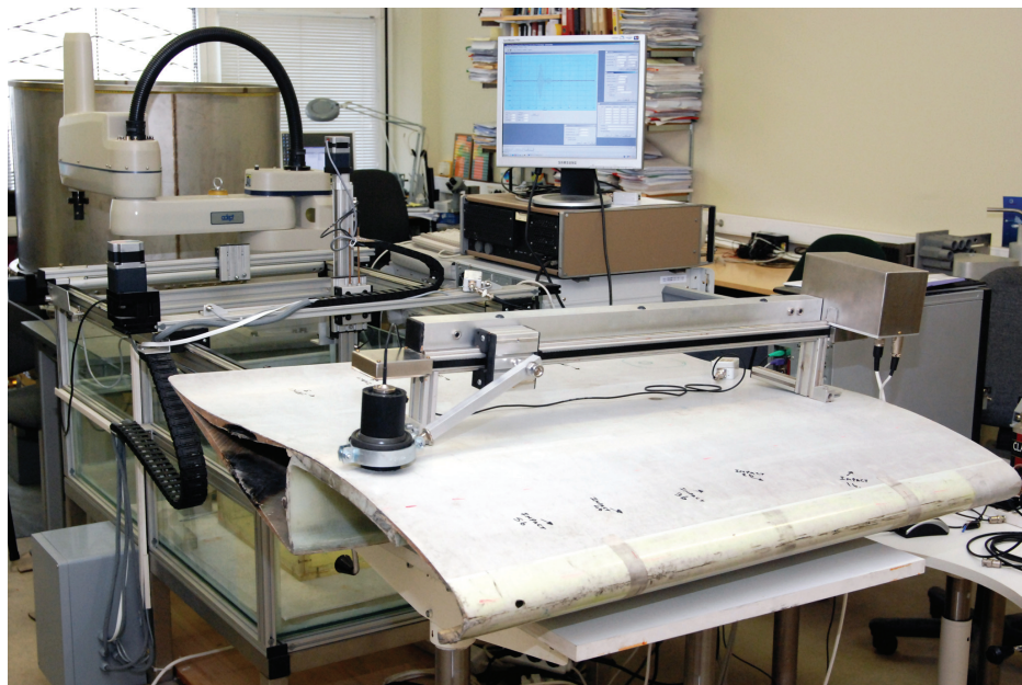
Specializuota ultragarsinė įranga vėjo jėginių menčių struktūros neardomiems bandymams

Institutas įkurtas 1999 m. pertvarkius Ultragarso mokslo centrą. Pagrindines pareigas institute turi 13 darbuotojų, iš jų 9 mokslininkai: 1 habilituotas daktaras ir 8 daktarai.