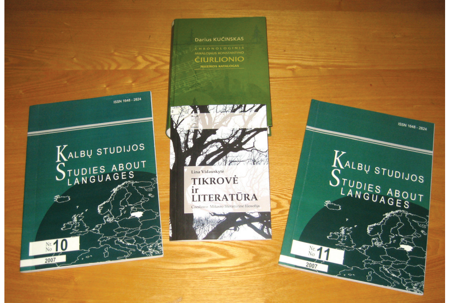
Reikšmingiausi pastarųjų metų leidiniai

Fakultetas įkurtas 2000 m. Pagrindines pareigas jame turi 90 darbuotojų, iš jų 24 mokslininkai. Yra 1 habilituotas daktaras, 21 daktaras