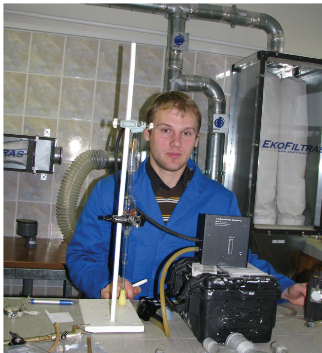
Oro taršos tyrimų laboratorijoje

Fakultetas įkurtas 1947 m. Pagrindines pareigas fakultete turi 152 darbuotojai, iš jų 97 mokslininkai: 10 habilituotų daktarų, 87 daktarai.