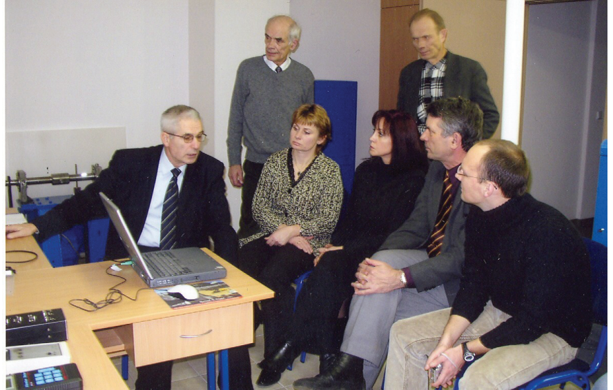
TSD instituto kolektyvas